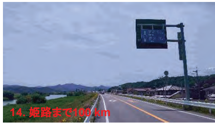
14. 姫路まで136 km