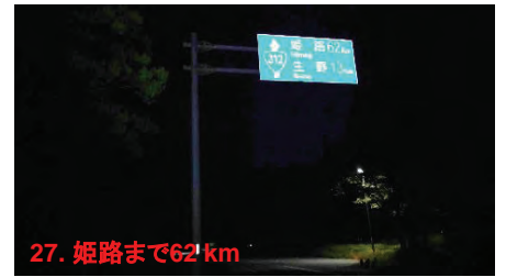
27. 姫路まで62 km