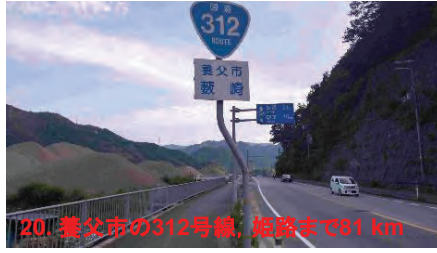
20. 養父市の312号線, 姫路まで81 km