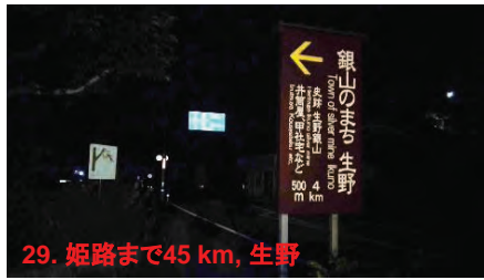
29. 姫路まで45 km, 生野