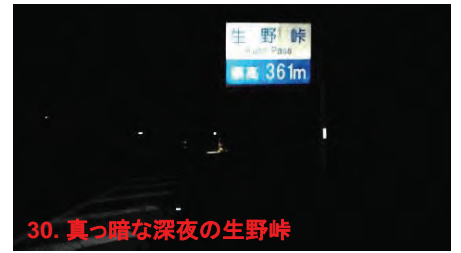
30. 真っ暗な深夜の生野峠