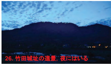
26. 竹田城址の遠景, 夜にはいる