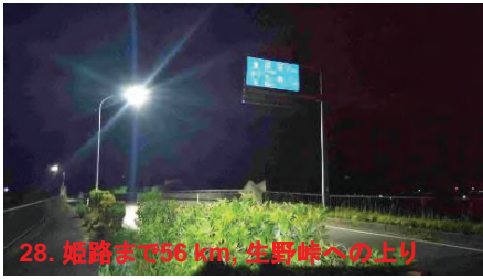
28. 姫路まで56 km, 生野峠への上り