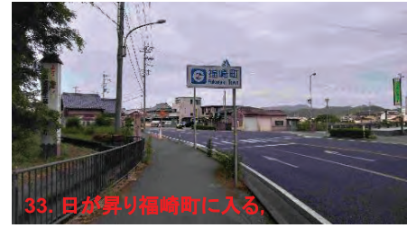
33. 日が昇り福崎町に入る,