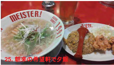
25. 朝来の希望軒で夕飯