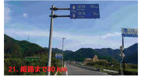
21. 姫路まで80 km